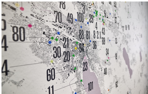
Hier wird gebaut: Siegerprojekte 2022–2024