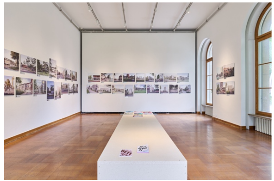
Gesamtschau: Erstplatzierte 2022–2024, Ausstellungs- ansicht ZAZ BELLERIVE, © Nakarin-Fotografie 2024