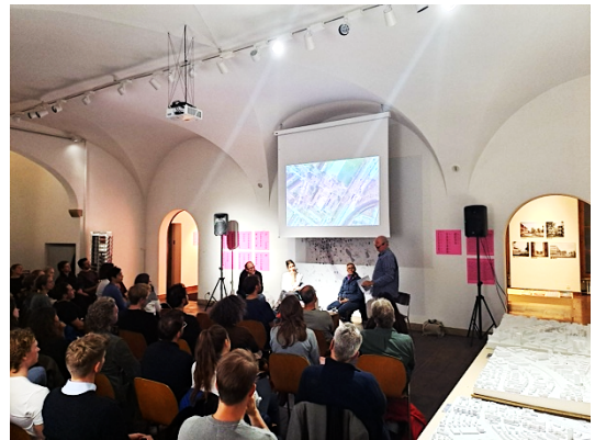
now what? – what if?, © ZAZ BELLERIVE 2024

07.11.2024: «Zugang zum Wettbewerb», Gespräch, in Kooperation mit Stiftung Forschung Planungswettbewerbe.