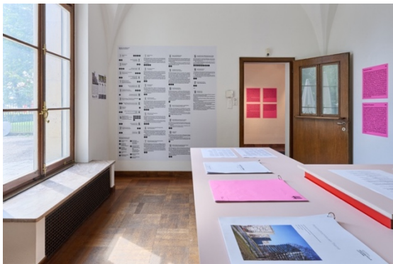
Wettbewerbe in Theorie und Praxis: Intro von A bis Z