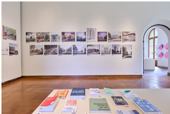
Ausstellungsansicht «Wettbewerbe» im ZAZ BELLERIVE