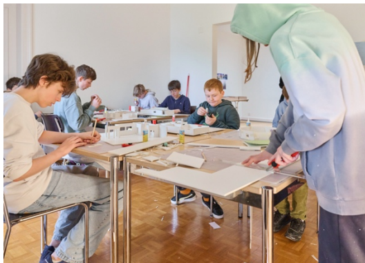
Impressionen aus dem Atelier

22.04.2024–26.04.2024, Ferienworkshop: «Ein Haus entsteht: Von der Skizze bis zum Bauwerk, mit Le-Wan Tran.