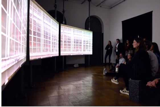
Immersive Reisen im ZAZ BELLERIVE