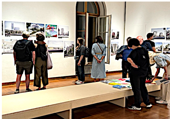
Führungen durch die aktuelle Ausstellung