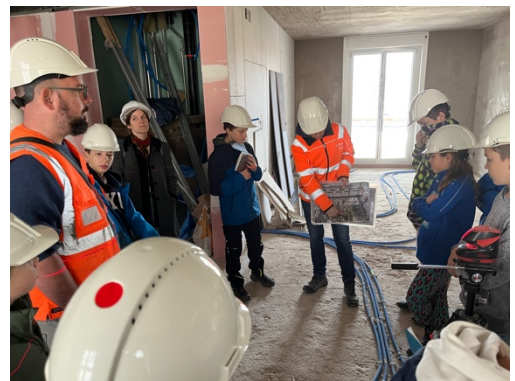
Auf Baustellenbesichtigung

23.05.2024: «(K)ein Einfamilienhaus», Kurzpräsentationen und Diskussion moderiert von Lucia Gratz.