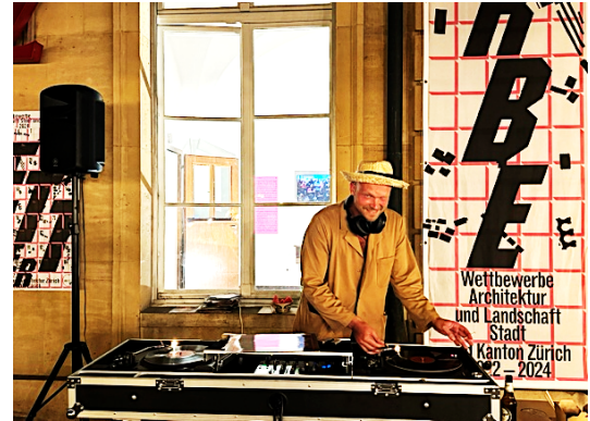
night fever am See