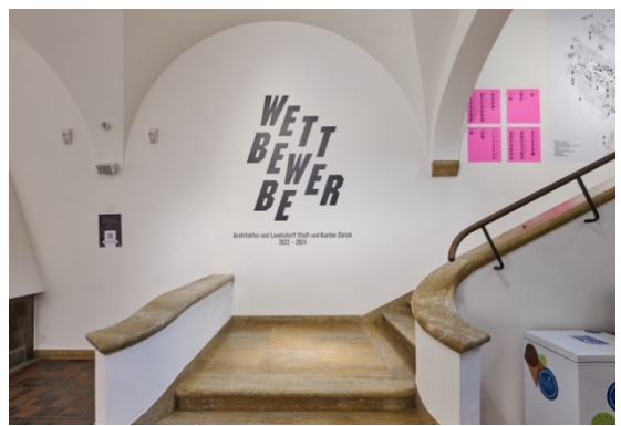
Ausstellungsansicht «Wettbewerbe» im ZAZ BELLERIVE