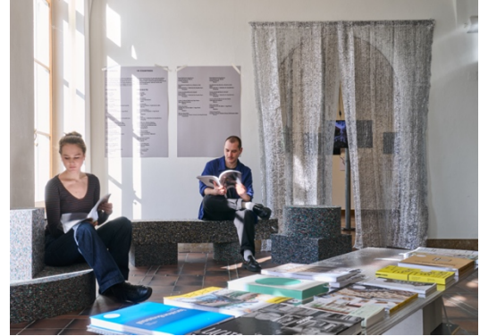
Lektüren in der Ausstellung «A Lot With Little»