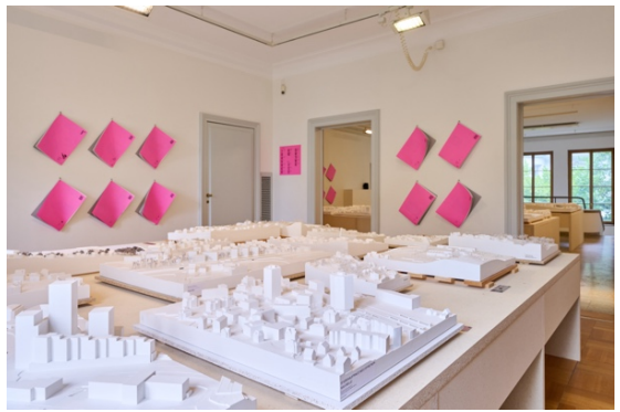
Ausstellungsansicht «Wettbewerbe» im ZAZ BELLERIVE