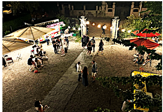
Die lange Nacht der Museen

14.09.2024: «La Folia», Konzert in Kooperation mit Ensemble Le Pli.