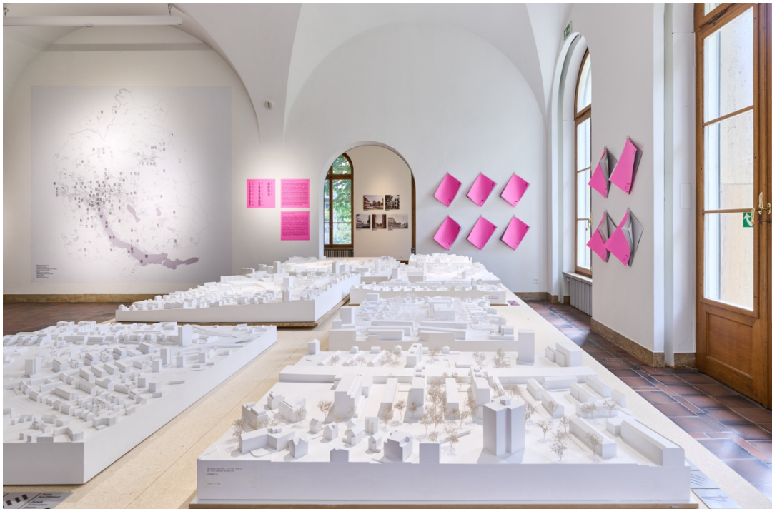
Im Fokus: Siegerprojekte in Schwamendingen, Ausstellungsansicht «Wettbewerbe», © Nakarin-Fotografie 2024

Unsere Lebensräume befinden sich in stetigem Wandel. Wettbewerbe für Architektur und Landschaft sind dabei eines der wichtigsten Instrumente, die bauliche Entwicklung zu planen und voranzutreiben. Allein das Amt für Hochbauten Stadt Zürich und das Hochbauamt Kanton Zürich loben jedes Jahr etwa fünfzehn Wettbewerbe aus, dutzende weitere werden anderweitig veranstaltet – von der öffentlichen Hand, Genossenschaften, Stiftungen und privaten Unternehmen. Doch von der Bekanntgabe des Gewinnerprojekts bis zu dessen Ausführung vergehen oft Jahre. So bleibt es schwer, Übersicht zu behalten, wie und wo sich unsere urbane Landschaft weiterentwickelt – für Architekt:innen wie auch für die Bevölkerung.