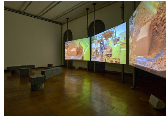
Im Fokus: Nachhaltige Architekturen im globalen Süden

In einer Welt, die sich mit unvorhersehbaren Ereignissen und eskalierenden Naturkatastrophen konfrontiert sieht, kommt der Architektur eine noch nie dagewesene Verantwortung zu. Wenn beinahe 40% der globalen CO 2 -Emissionen von der Bauindustrie verursacht werden, können die Auswirkungen des Klimawandels nicht mehr ignoriert werden. Der Mangel an Zeit, Geld und Ressourcen verlangt nachhaltige Wege, um Architekturen zu schaffen, die gesellschaftlichen Bedürfnissen gerecht werden, verfügbare Ressourcen zu nutzen wissen und die lokale Kultur, Wirtschaft und Umwelt berücksichtigen – eine ethische und verantwortungsvolle Haltung für eine gemeinsame Zukunft.