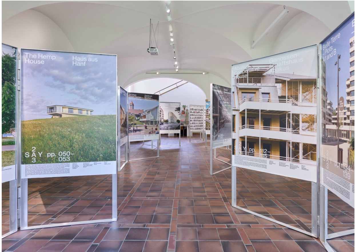
Ausgezeichnet! Ausstellungsansicht «SAY–Swiss Architecture Yearbook» im Foyer ZAZ BELLERIVE

Was sind die brennendsten Fragen, die von der Schweizer Architektur diskutiert werden? Was macht Architektur in der Schweiz aus und wie trägt sie nachhaltig zur Lebensqualität in allen Landesteilen bei? In neun thematischen Essays reflektiert das erste Schweizer Architektur Jahrbuch über das aktuelle Bau- und Umbaugeschehen mit dem Ziel, das Bewusstsein für die Schweizer Baukultur zu fördern und ihre Präsenz zu steigern. Das Schweizer Architektur Jahrbuch 2023/24 widerspiegelt die enorme Vielfalt des schweizerischen Architekturschaffens und gibt der hohen Qualität von Schweizer Architektur und Baukultur endlich auch international ein Gesicht.