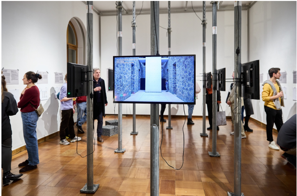
Architektur in der Verantwortung, Filminstallationen im ZAZ BELLERIVE