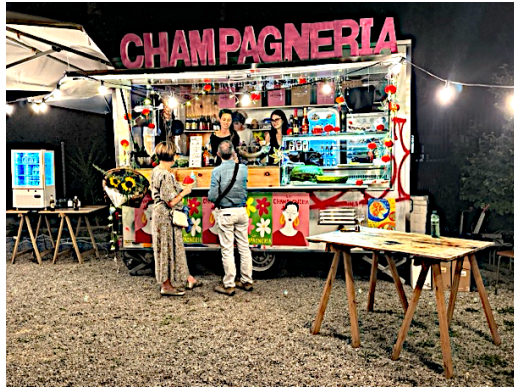
... eine lange Nacht ist eine lange Nacht ist eine lange ...

07.09.2024: Lange Nacht der Museen mit Kurzführungen, Barbetrieb und DJ, in Kooperation mit dem Verein Zürcher Museen.