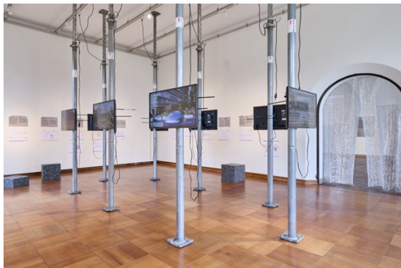
Biographische Einblicke: installative Filmporträts