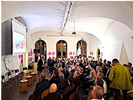
Buchvernissage Lignum

31.10.2024: «Holzbau mit System», Buchvernissage mit Kurzreferaten und Podium, mit Lignum.